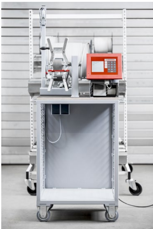
Messwagen mit mit fest installiertem Messgerät, Wickelhaspel und kundenseitig beige-stelltem Computer/Drucker.